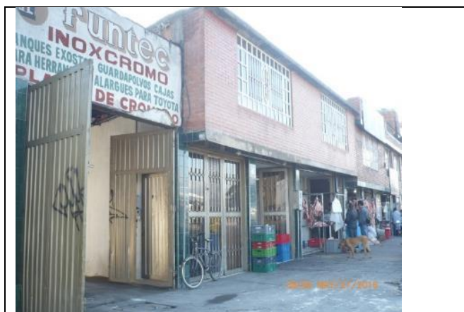
6. Autopista Sur No. 62 F - 36 - AAA0052YDEA

Esta Secretaría aclara que la gestión y las actuaciones adelantadas desde 2013 a la fecha, se han desarrollado bajo el principio de prevención, y aras de evitar un posible daño ambiental; sin embargo con la expedición de la Resolución 1851 de 2015 , han cambiado las causas que dieron lugar a su imposición, por lo cual se procede a levantar la medida